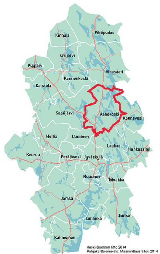
Kuva 1 Keski-Suomen kunnat

Tämän tarkastelun painopiste on asumisessa syntyvissä jätteissä.