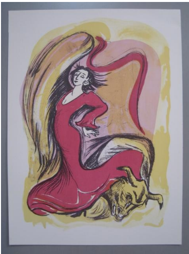
Flamenco 2, 2008