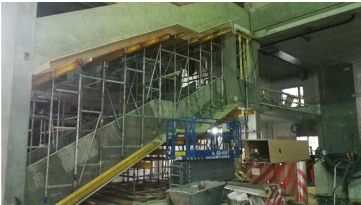
Sisäportaan valutyöt tehtynä kulttuuriallassa.