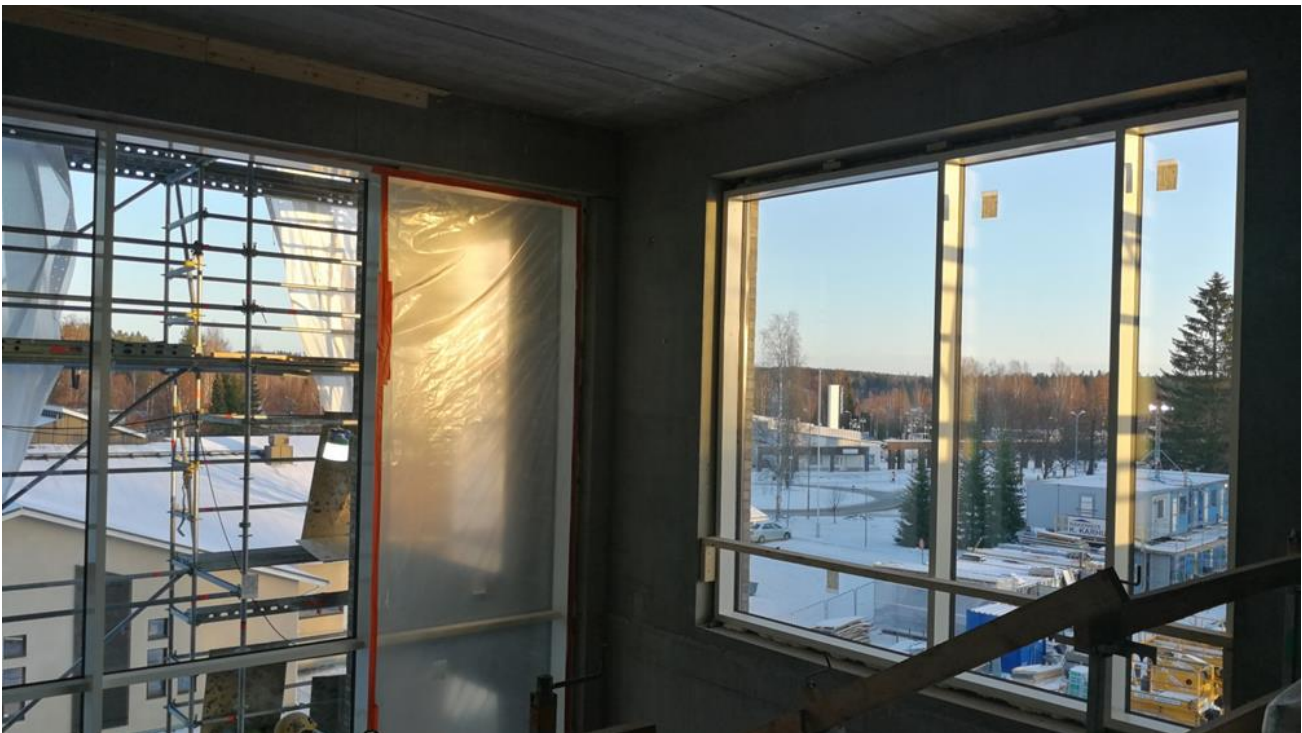
Itäpäädyn sisääntuloportaan 3 krs. aulan näkymä.