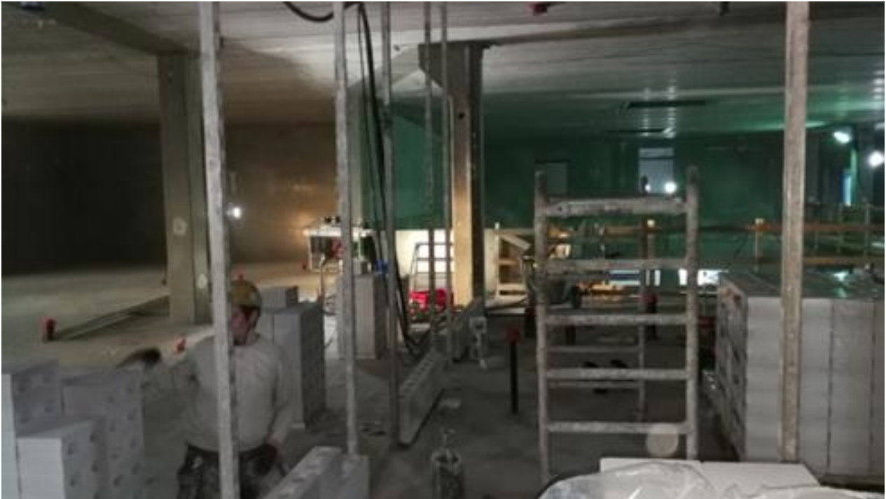
Väliseinämuuraukset ja levytykset käynnissä.