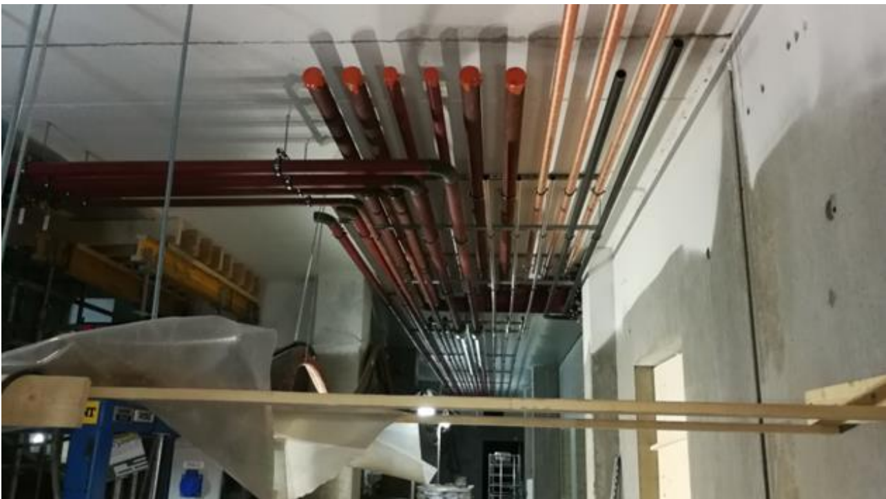
Talotekniikkatyöt etenevät ajallaan.